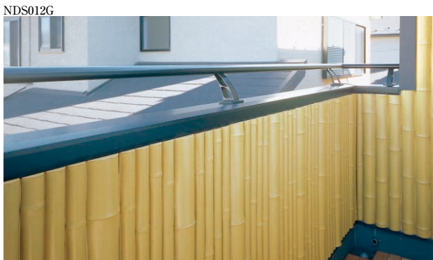
▲取付け後(コーナー材はありません)