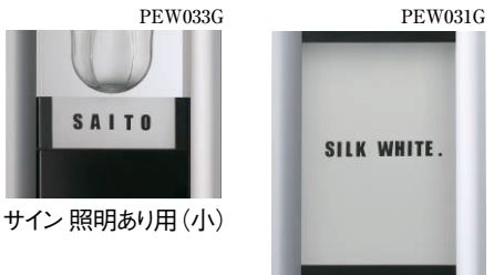
サイン 照明あり用(小) サイン 照明なし用(大)

ネームシール シールは大文字アルファベット・文字天地 15mmが付いています。 シール色は黒色です。