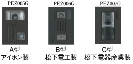
A型 アイホン製 B型 松下電工製 C型 松下電器産業製

内蔵タイプは、機種によってインターホンカバーが異なります。P.1710のインターホンカバー対応インターホン表をご参照ください。