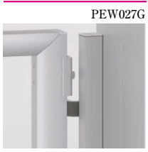
表 機能門柱に門扉を吊り 込む場合は、吊元部材 を取付けます。