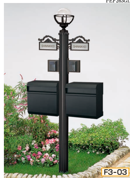
3型 ポール高:1800 [CBブラック] 照明KM1型 (標準) + ガードA、サインE型 (シール付) X2 インターホン台座A型 X2、ポストYA12型 X2 ポスト台座YA12型用 X2

組合せ価格 ¥145,500 (インターホン・ステンレスプレート表札価格は含まれておりません)