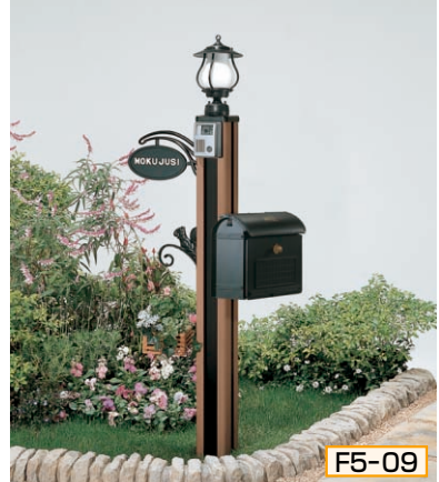
5型 ポール高:1350 [ミディアムブラウンP] 照明LK22型(標準)、インターホン台座5型用サインD型(シール付)、ポストUN1B型、ポスト台座UN(側面)型用、ハンガーフックD型

組合せ価格 ¥118,300 (ハンガーフックなし) ¥124,700 (ハンガーフックつき) (インターホン価格は含まれておりません)