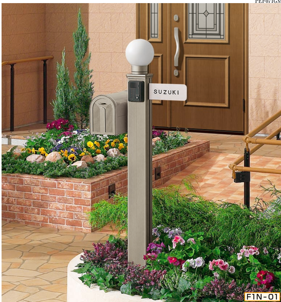
1N型 [CBステン] ポール高:1400 照明LK11型 (標準) サインF型 (シール付) ポストBM1型 ポスト台座F型つき

注 ●電源や電気工事は必ず電気工事店様、または電気店様におまかせください。電気の仕事は「危険」ですので、絶対にしないでください。 機能部品のCBブラック用はブラック、CBブラウン用はブラウン、CBステン用はステンカラーでCB色にコーディネートできる塗装色です。