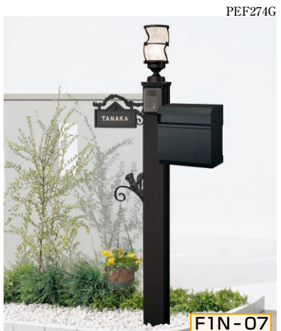
1N型 ポール高:1400 [CBブラック] 照明KM2型 (標準) + ガードB・サインE型 (シール付) ポストYA12型・ポスト台座YA12型用、ハンガーフックD型

組合せ価格 ¥87,600 (ハンガーフックつき) (インターホン価格は含まれておりません)