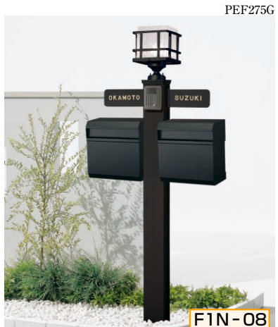
1N型 ポール高:1400 [CBブラック] 照明KM3型 (標準) + ガードC サインF型 (シール付) ×2、ポストYA12型×2、ポスト台座YA12型用×2

組合せ価格 ¥86,400 (ハンガーフックつき) (インターホン価格は含まれておりません)