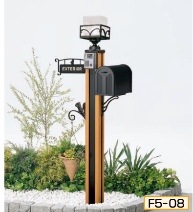
5型 ポール高:1350 [ライトブラウンP] 照明KM3型(標準) + ガードB、インターホン台座5型用サインYH2型(シール付)、ポストBM1型、ポスト台座D型、ハンガーフックD型

組合せ価格 ¥96,700 (ハンガーフックなし) ¥103,100 (ハンガーフックつき) (インターホン価格は含まれておりません)