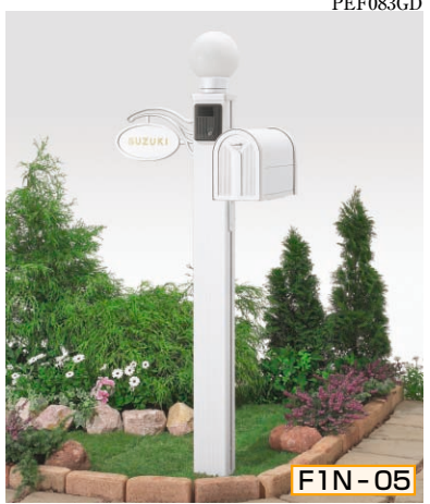
1N型 ポール高:1400 [ホワイト] 照明LK11型 (標準)・サインD型 (シール付) ポストBM1型・ポスト台座F型