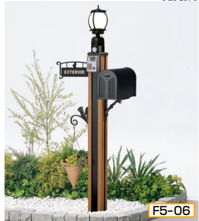
5型 ポール高:1350 [ミディアムブラウンP] 照明LK19J型(自動点滅器付)、インターホン台座5型用サインYH2型(シール付)、ポストBM1型、ポスト台座E型、ハンガーフックD型

組合せ価格 ¥98,900 (ハンガーフックなし) ¥105,300 (ハンガーフックつき) (インターホン価格は含まれておりません)