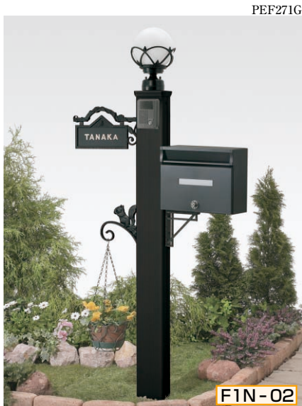
1N型 ポール高:1400 [CBブラック] 照明LK23型 (標準)・サインE型 (シール付) ナチュラル角型・ポスト台座Bセット ナチュラル角型用・ハンガーフックD型