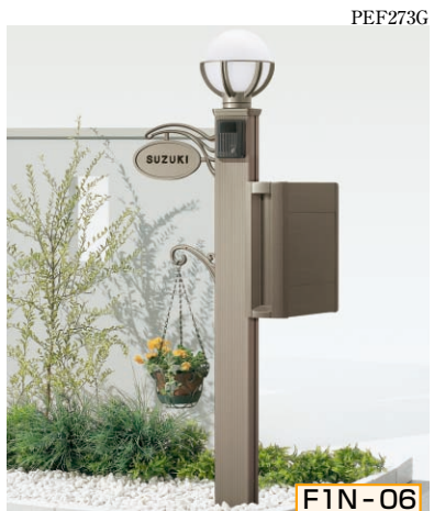
1N型 ポール高:1400 [CBステン] 照明LK5型 (標準)・サインD型 (シール付) ポストTA4型・ポスト台座TA型用・ハンガーフックC型