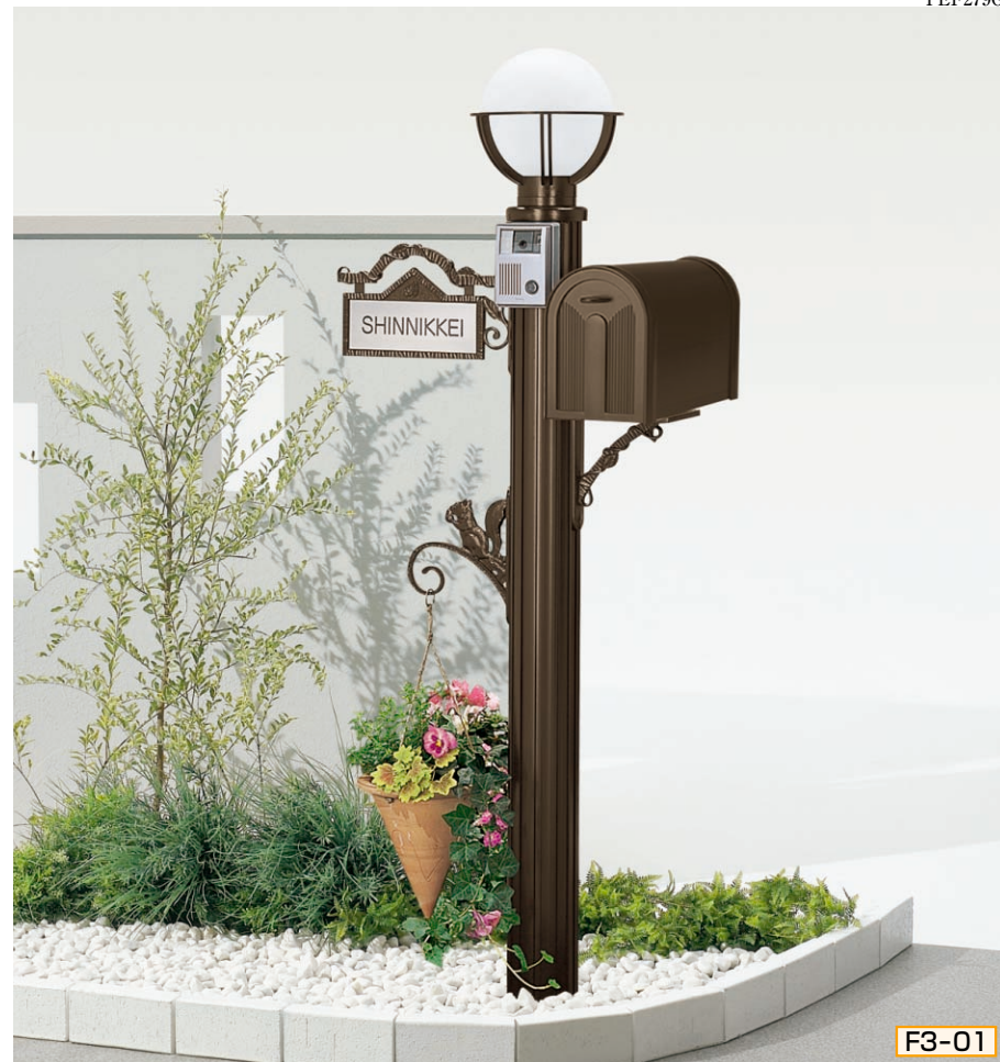
3型 ポール高:1350 [CBブラウン] 照明LK5型 (標準) インターホン台座3型用 サインE型 (シール付) ポストBM1型 ポスト台座E型 ハンガーフックD型

機能部品のCBブラック用はブラック、CBブラウン用はブラウン、CBステン用はステンカラーでCB色にコーディネートできる塗装色です。