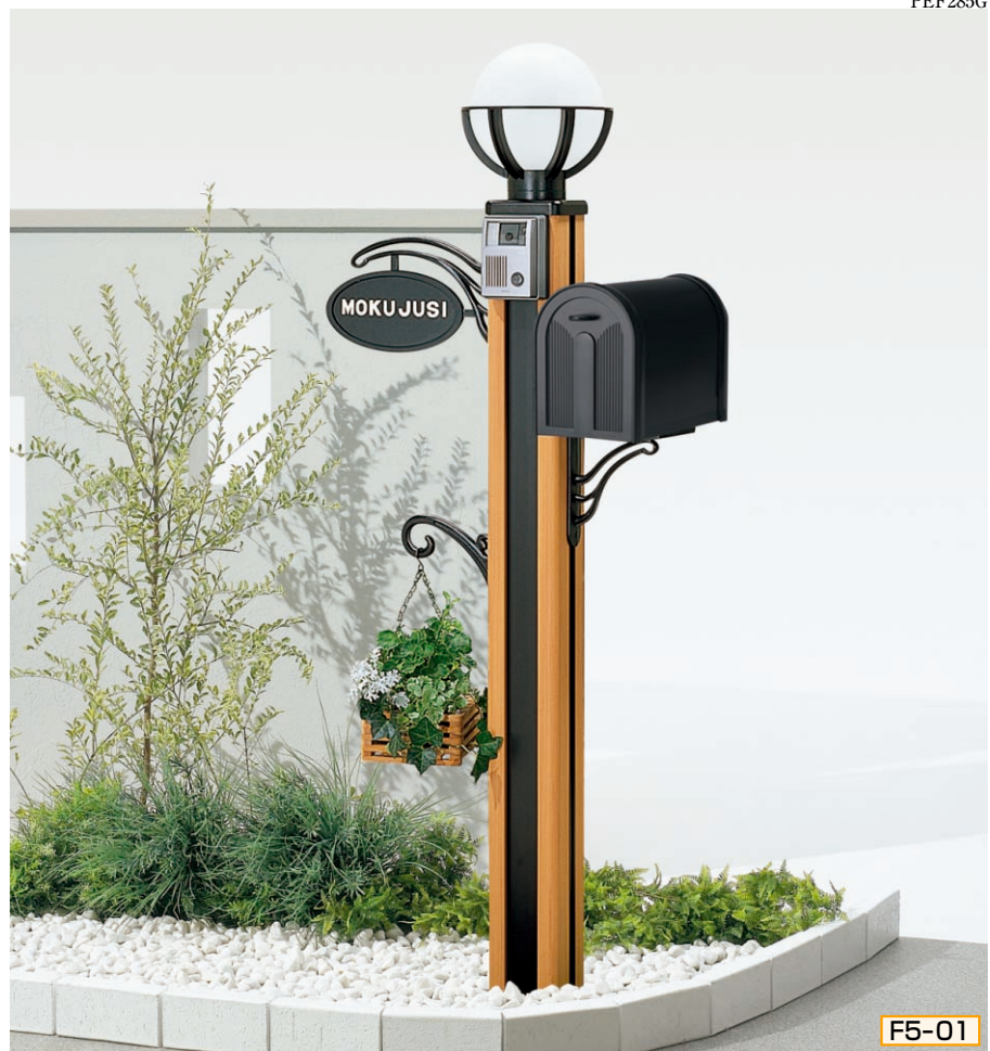
5型 ポール高:1350 [ライトブラウンP] 照明LK5型(標準)、インターホン台座5型用、サインD型(シール付)、ポストBM1型、ポスト台座D型、ハンガーフックC型

組合せ価格 ¥95,600 (ハンガーフックなし) ¥102,000 (ハンガーフックつき) (インターホン価格は含まれておりません)