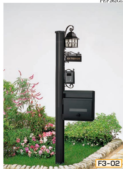
3型 ポール高:1800 [CBブラック] 照明KB1A型 (人感センサ付)、KB1A型照明台座 インターホン台座B型、サインCII型 (シール付) ポストYA11型、ポスト台座YA11型

組合せ価格 ¥86,800 (ハンガーフックなし) ¥93,200 (ハンガーフックつき) (インターホン・ステンレスプレート表札価格は含まれておりません)