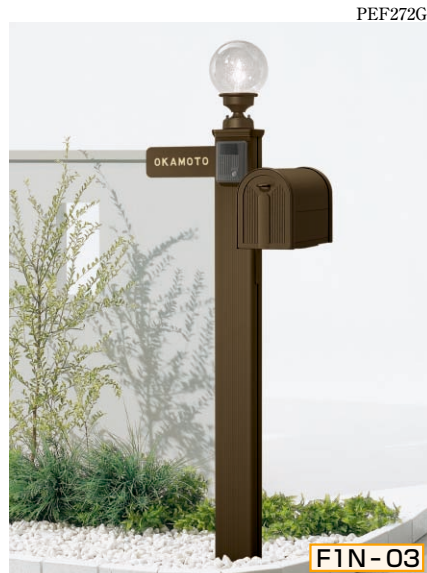
1N型 ポール高:1400 [CBブラウン] 照明KM1型・サインF型 (シール付) ポストBM1型・ポスト台座F型

組合せ価格 ¥83,100 (ハンガーフックつき) (インターホン価格は含まれておりません)