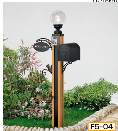
5型 ポール高:1350 [ライトブラウンP] 照明KM1型(標準)、インターホン台座5型用サインD型(シール付)、ポストBM2型、ポスト台座D型、ハンガーフックD型

組合せ価格 ¥91,300 (ハンガーフックなし) ¥97,700 (ハンガーフックつき) (インターホン価格は含まれておりません)