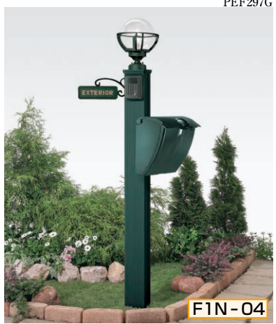
1N型 ポール高:1400 [モスグリーン] 照明KM1型 (標準) + ガードA・サインYH1型 (シール付) ポストUA1型・ポスト台座UA (側面) 型用