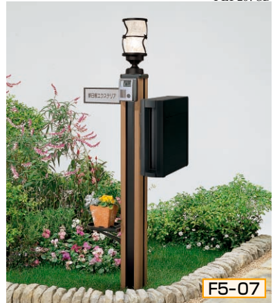
5型 ポール高:1350 [ミディアムブラウンP] 照明KM2型(標準) + ガードB、インターホン台座5型用、サインB型(シール付)、ポストTA4型、ポスト台座TA4型用、プランターA型

組合せ価格 ¥98,800 (プランターなし) ¥109,000 (プランターつき) (インターホン・ステンレスプレート表札価格は含まれておりません)