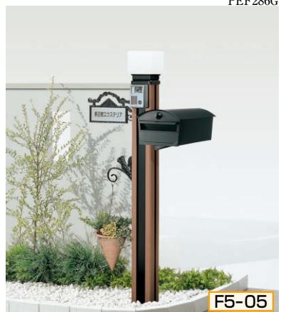
5型 ポール高:1350 [ミディアムブラウンP] 照明LM10型(標準)、インターホン台座5型用、サインE型(シール付)、ポストBN2B型、ポスト台座BN型用、ハンガーフックD型

組合せ価格 ¥102,400 (ハンガーフックなし) ¥108,800 (ハンガーフックつき) (インターホン・ステンレスプレート表札価格は含まれておりません)