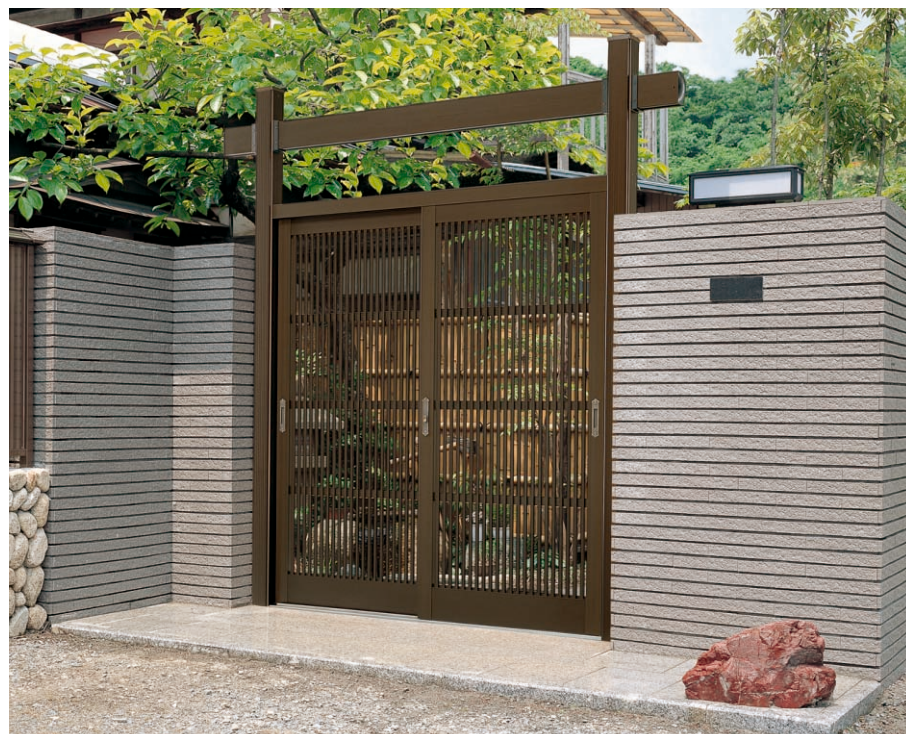
袖なし/鳥居タイプ/柱・千本格子障子