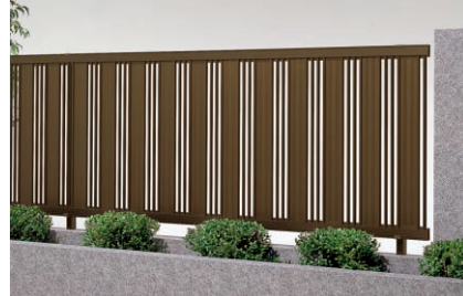
涼雅フェンスNシリーズ [P.718]