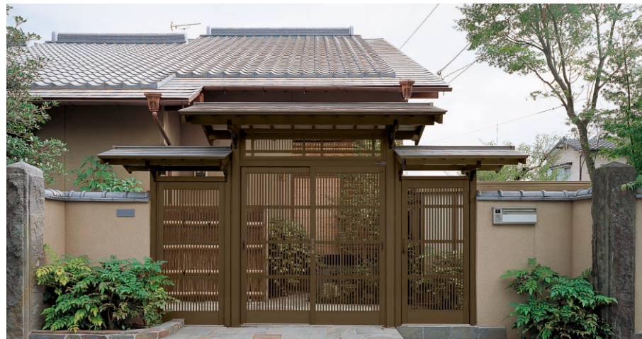
両袖片くぐり戸つき/大屋根・たて格子らんま・千本格子障子・左側はめ殺し戸・右側くぐり戸・自立柱タイプ