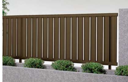
涼雅フェンスNシリーズ [P.718]