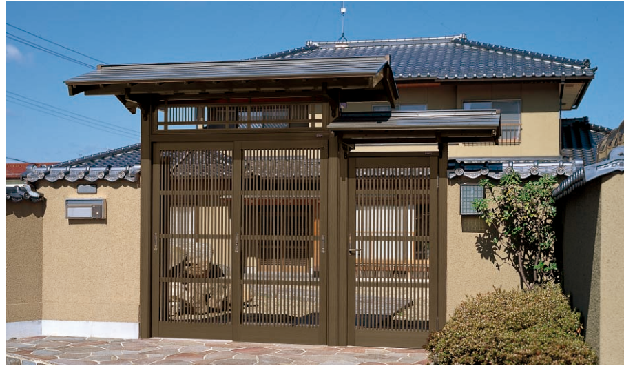
片袖くぐり戸つき/大屋根・たて格子らんま・千本格子障子・右側くぐり戸・自立柱タイプ