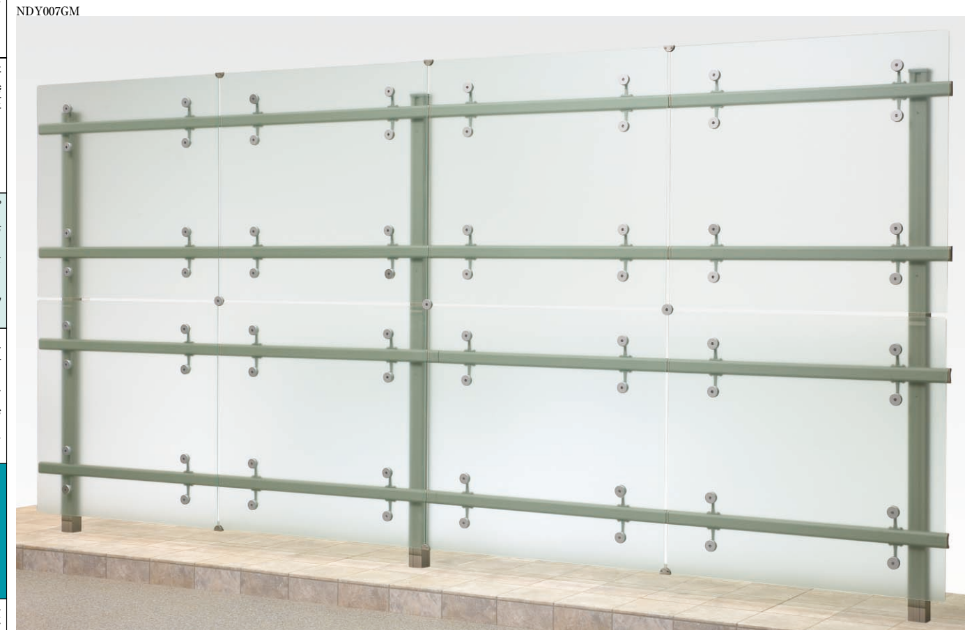
2段自在柱式 上段 巾:2000×高:1000、下段巾:2000×高:1000 パネル巾:1000用